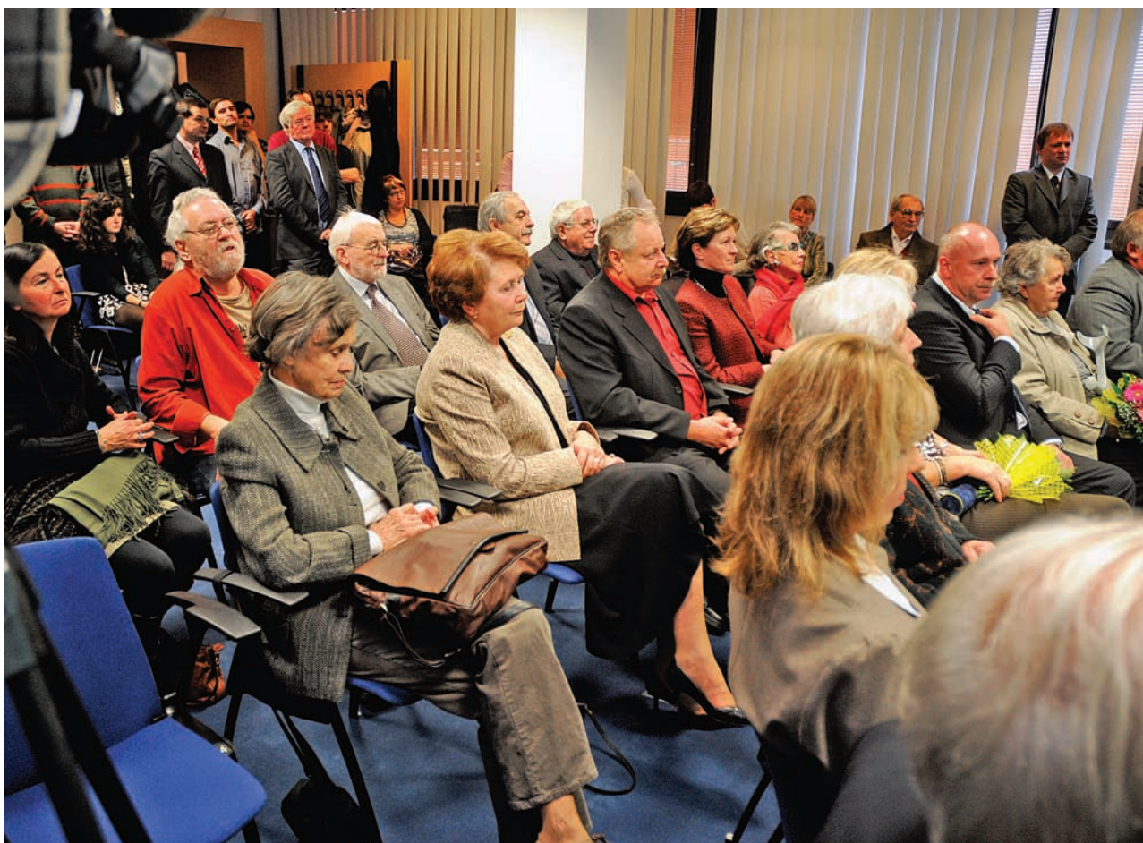
Ocenění a jejich potomci v zasedacím sále budovy ÚSTR