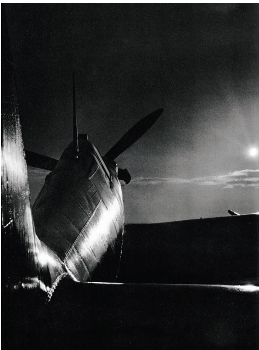
Jedna ze stíhaček Hurricane, na kterých českoslovenští piloti létali