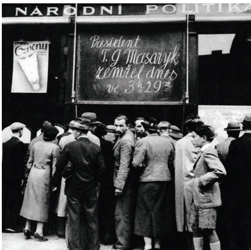
Dne 14. září 1937 zemřel Tomáš G. Masaryk. Ladislav Sitenský takto zachytil atmosféru v Praze poté, co zpráva vešla ve známost.