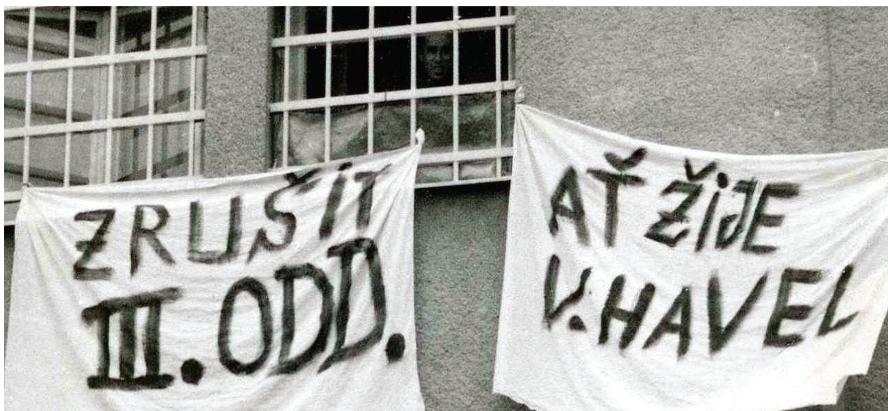
Také valdičtí vězni se zapojili do „revoluce“ v listopadu 1989. Jedním z požadavků bylo zrušení třetího oddělení.