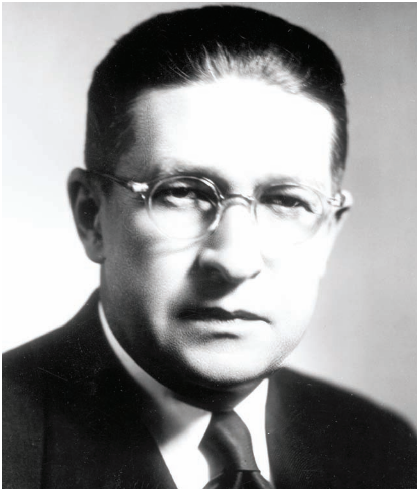
Prokop Drtina, bývalý tajemník prezidenta Beneše, napsal ve valdické věznici první část svých pamětí Československo, můj osud