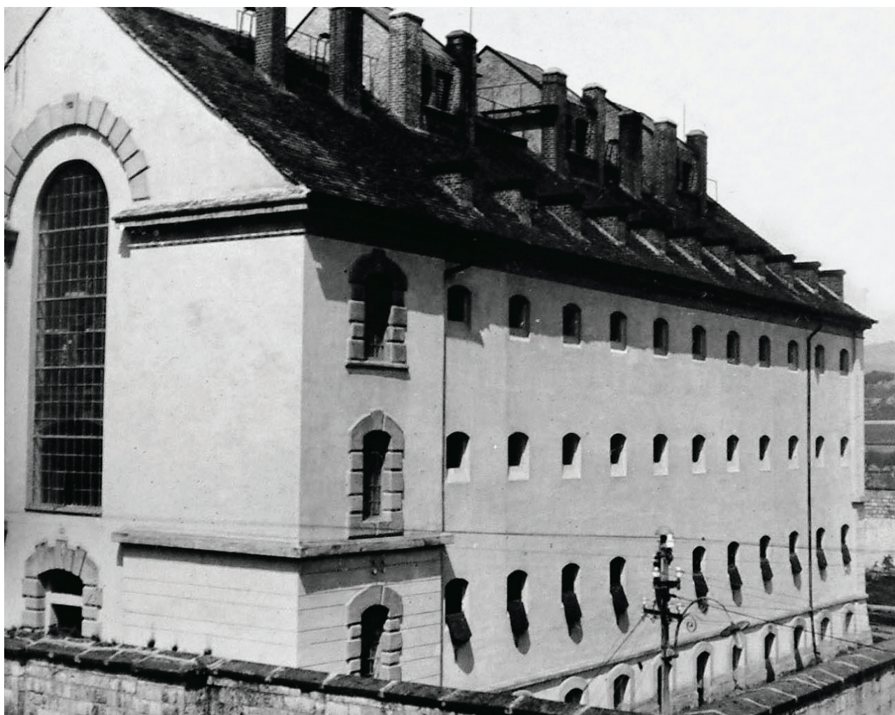
Obávané valdické třetí oddělení