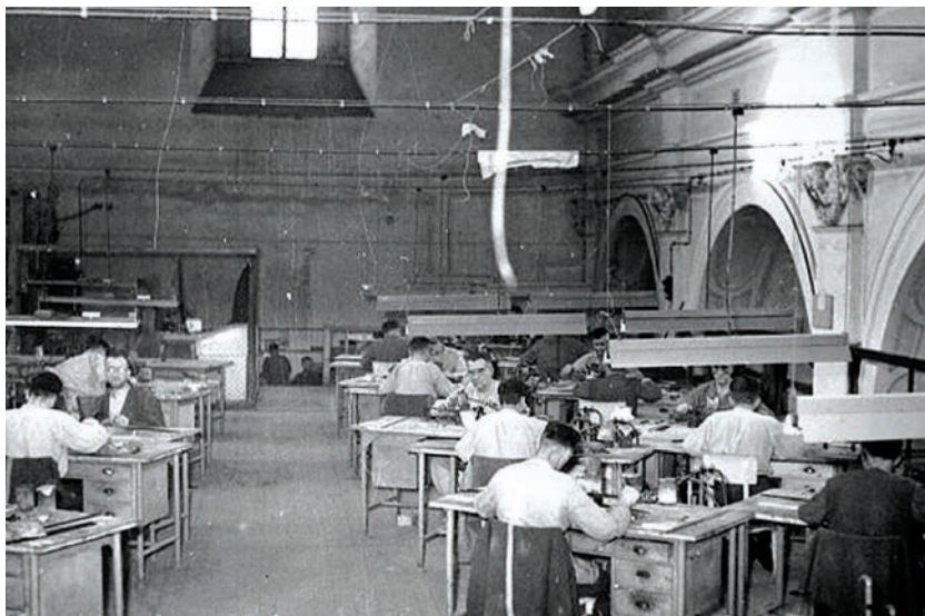
Dílna zřízená v bývalém kostele. Snímek pochází z 50. let.

ale dalo podle bachařových kroků vysledovat, kdy se přibližuje a kdy se naopak vzdaluje, a tak jsem si mohl aspoň na chvíli sednout. 5 Někdy v první polovině roku 1951 přešlo oddělení samovazby pod správu trestnice. Kněží sice zůstali nadále v izolaci, avšak poměry se přeci jen zlepšily, takže mohli pracovat na zahradě nebo při opravách budovy. Po práci se na samotkách dokonce snažili sloužit mše. 6