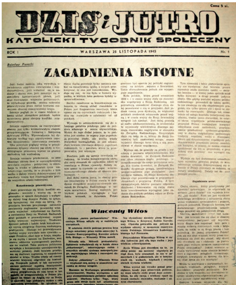
První číslo časopisu Dziś i Jutro