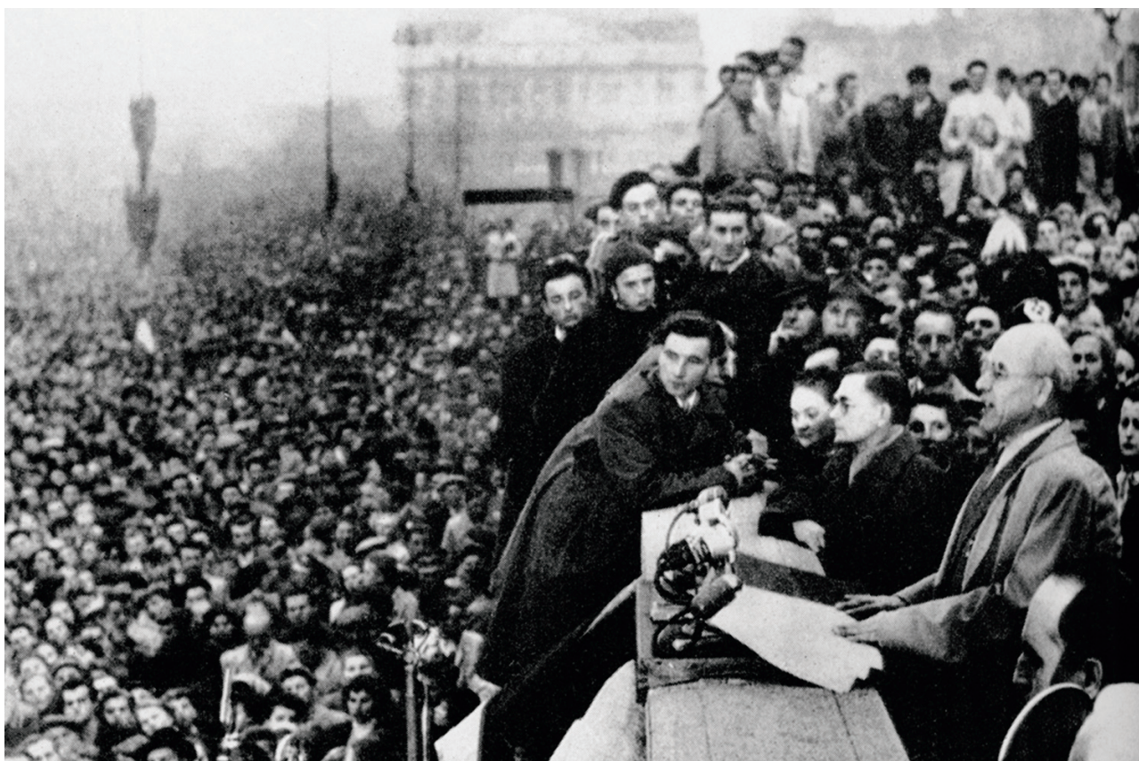
Władysław Gomułka, znovupostavený do čela strany jako 1. tajemník, hovoří k masám ve Varšavě 24. října 1956