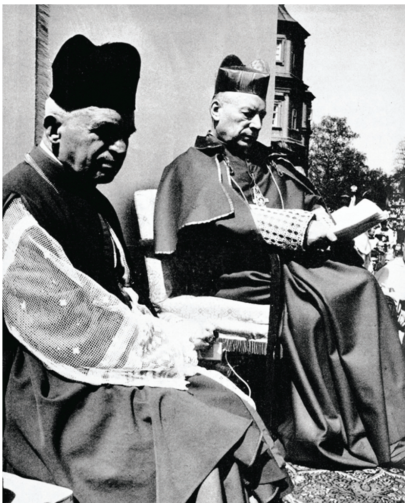
Kardinál Stefan Wyszyński se svým kaplanem v Czenstochowé během oslav tisíciletí polského státu v roce 1966