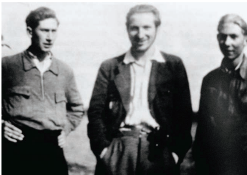
V odboji na Podlesí