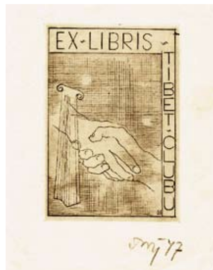
Ex libris Tibet klubu