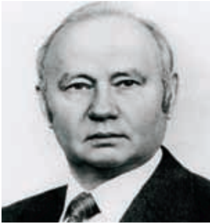
Armádní generál Vladimír Alexandrovič Krjučkov, v letech 1988–1991 předseda KGB