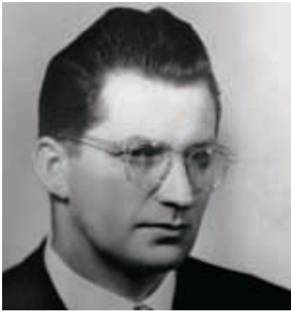
Lubomír Štrougal, poprvé byl ministrem vnútra ČSSR v letech 1961-1965