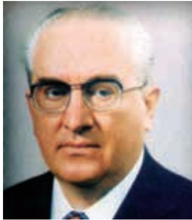
Jurij Vladimirovič Andropov byl předsedou KGB v letech 1967–1982