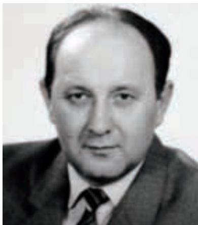
Federálny minister vnútra ing. František Kincel

Príprava rokovania delegácií zástupcov federálneho ministerstva vnútra ČSSR a Výboru štátnej bezpečnosti pri Rade ministrov ZSSR prebiehala už od jari 1989. Na základe pozvania nového predsedu KGB arm. gen. Vladimíra Alexandroviča Krjučkova sa malo rokovanie uskutočniť v Moskve. Termín bol stanovený na koniec mája a začiatok júna 1989.