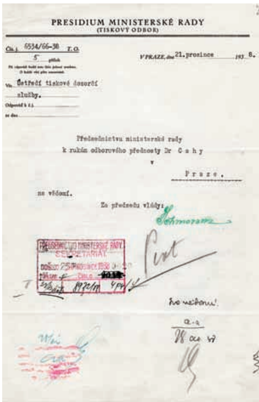
Jeden z řady dokumentů vztahujících se k činnosti Ústředí tiskové dozorcí služby