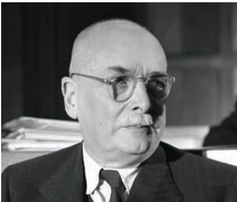
Otakar Fischer (1884-1968) byl ministrem vnitra od 1. 12. 1938 do 27. 4. 1939