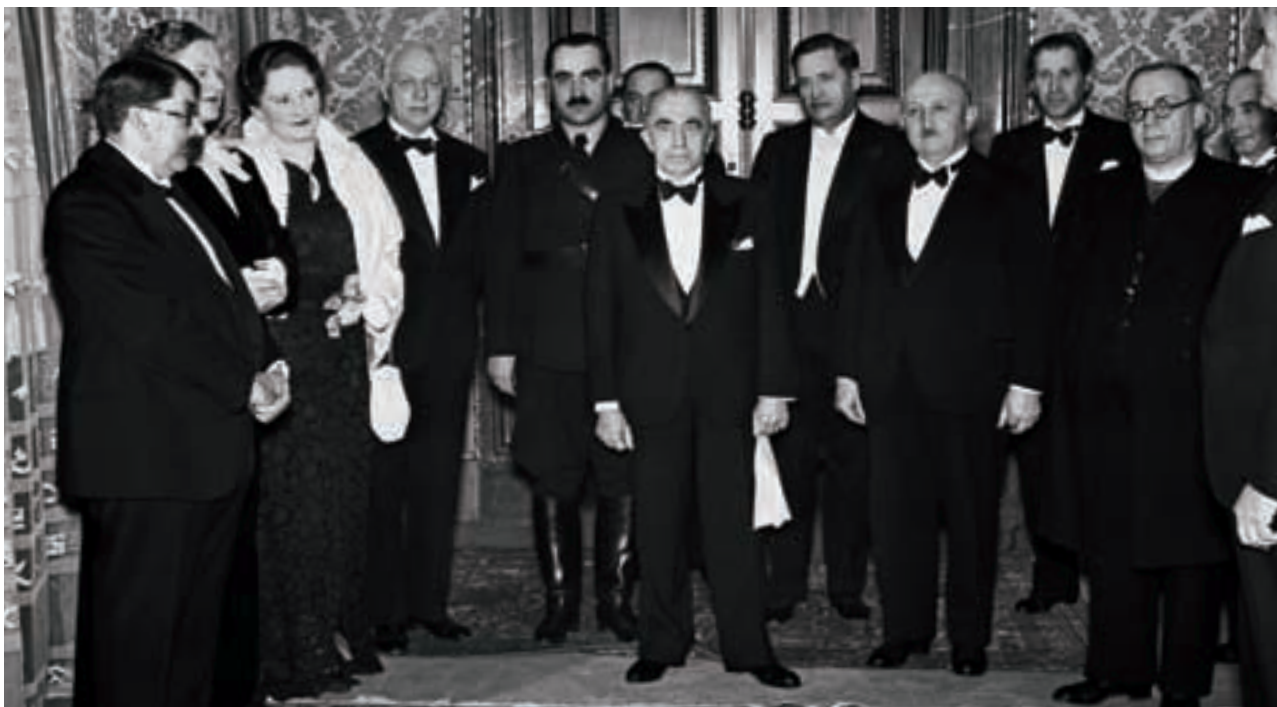
Prezident republiky Emil Hácha (uprostřed) a premiér Rudolf Beran (po Háchově levici) navštívili 14. prosince 1938 představení Prodané nevěsty v Národním divadle.