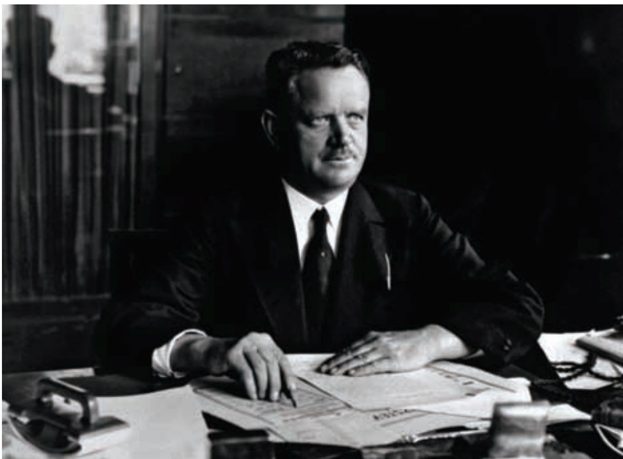
Antonín Hampl (1874–1942), předseda Československé sociálně demokratické strany dělnické a od prosince 1938 předseda Národní strany práce. Zatčen nacisty 6. 5. 1941 a 17. 5. 1942 popraven v Berlíně.