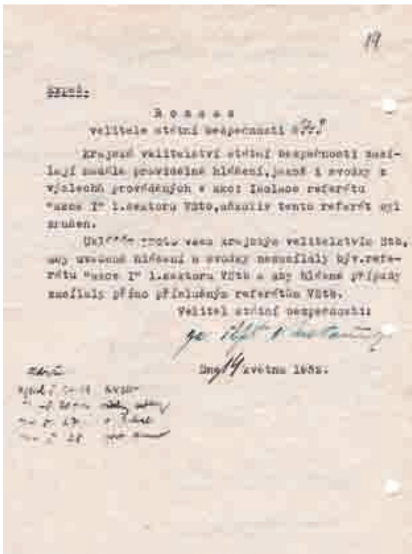
Rozkaz velitele StB ve věci „Akce Isolace“

Na počátku 60. let začala akce Isolace přešetřovat v rámci šetření nezákonností StB Inspekce ministra vnitra (nikdo ovšem nebyl za vedení Isolace potrestán). Ani po deseti letech nebyli její tehdejší aktéři z řad Státní bezpečnosti ochotni přiznat její nezákonnost a nevhodnost. Podle nich sice na jedné straně docházelo