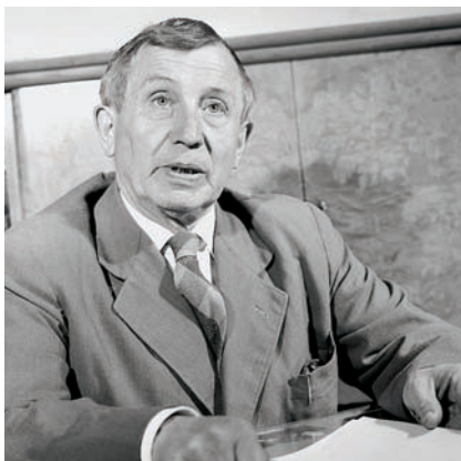
Ministrem vnitra se během jara 1968 stal Josef Pavel

V lednu 1968 na plenárním zasedání ÚV KSČ došlo k výměně stranického vedení, ve kterém získali vedoucí pozice reformátoři, a silící reformní tendence se začaly projevat i na ministerstvu vnitra. Mno-