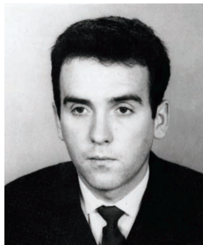
Fila v době nástupu k SNB

jako referent krajské správy MV v Hradci Králové. Zde postupně působil v útvaru sledování, pracoval také jako vyšetřovatel a operativní pracovník. Členem KSČ se stal v roce 1966. V letech 1967 až 1972, aniž by přestal pracovat pro StB, vystudoval Právnickou fakultu UK v Praze.