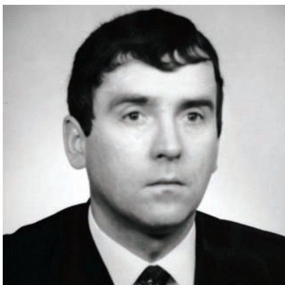
Fila v roce 1975