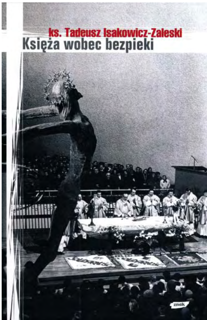
Obálka knihy P. Tadeusze Isakowicze-Zaleského ( Kněží a Státní bezpečnost )

Ústav byl vytvořen 19. ledna 1999 na základě zákona přijatého 18. prosince 1998. Cílem této státní organizace je shromáždit, uspořádat a zpřístup-