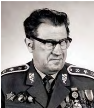
V roce 1968 byl plk. Viliam Šalgovič náměstkem ministra vnitra pro řízení StB