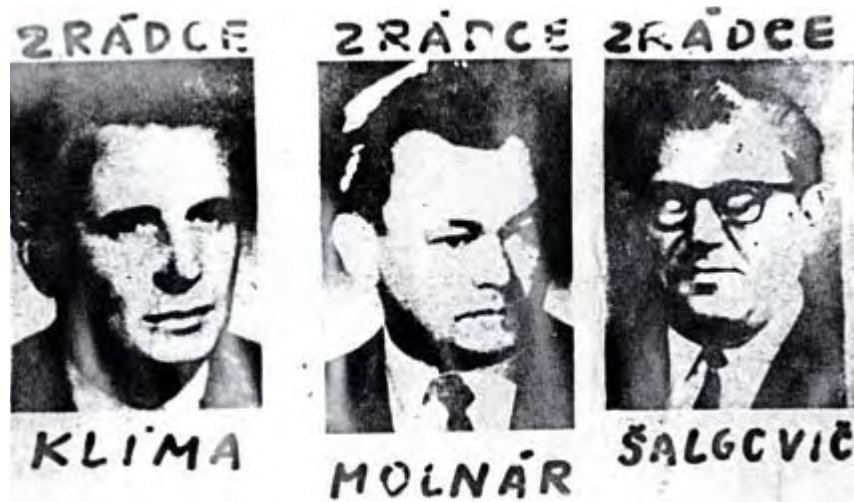
Jeden z letáků vytištěných útvary ministerstva vnitra