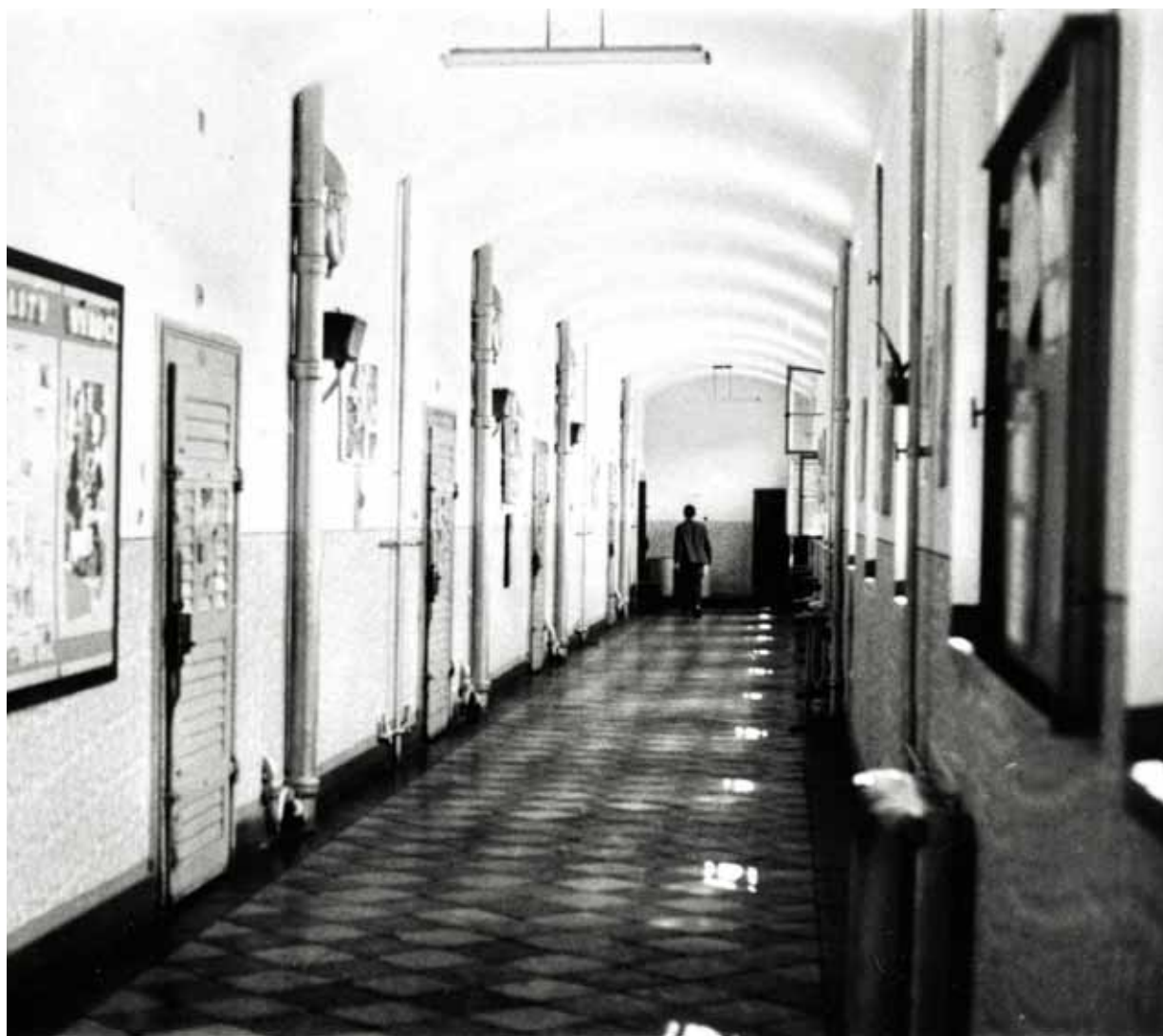
Chodba ve věznici v Plzni-Borech.