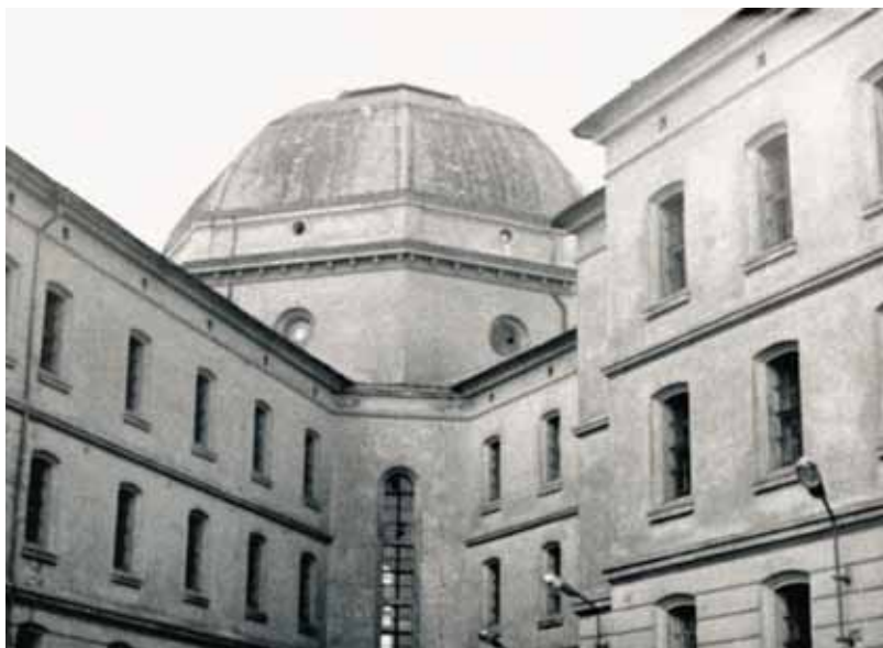
Pohled z venku na věznici Plzeň-Bory v sedmdesátých letech dvacátého století.

Zveřejnění dokumentu Charty 77 v zahraničních sdělovacích prostředcích a události v ČSSR s tím spojené samozřejmě nezůstaly bez odezvy ani za zamřížovanými okny věznic. Ještě předtím, na Nový rok, byl vězňům zařazeným rozsudkem soudu do I. nebo II. nápravně výchovné skupiny (NVS) umožněn poslech novoročního projevu prezidenta republiky. Nutno podotknout, že se setkal spíše s negativní odezvou. Zprávy o zveřejnění dokumentu Charty 77 v zahraničí vyvolaly u naprosté většiny odsouzených mimořádný zájem. Vězni se vyslovovali na jeho podporu, bez ohledu na to, za jaký trestný čin si trest odpykávali. Pozitivní zájem vzbudila i jména prvních signatářů, které vězni znali z období Pražského jara. Naopak velké rozhořčení způsobovalo, že text dokumentu Charty 77 je pranýřován v československých sdělovacích prostředcích, aniž by byl celý obsah dokumentu zveřejněn. 4 Rovněž velmi negativní ohlasy způsobovaly známé osobnosti, které veřejně vystoupily s kritikou Charty 77. Jedním z nich byl Emil Zátopek. Mezi odsouzenými kolovalo mínění, že to je člověk, který