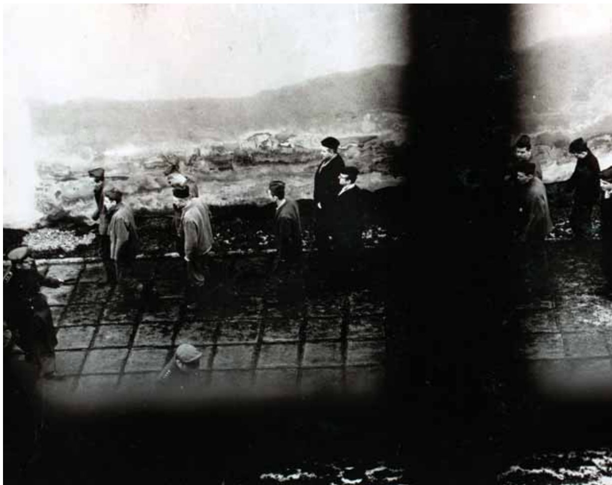
Odsouzení muži v nápravně výchovném ústavu Valdice.