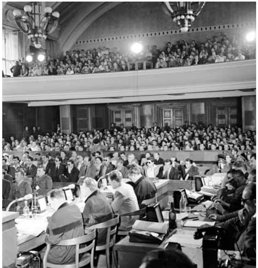
Obecenstvo se každý den procesu měnilo tak, aby žádný z diváků neměl komplexní zážitek z celého inscenovaného procesu.

pořízeny zvětšené snímky rozvratníků, které s příslušným textem budou dány do výloh. Dále informují, že proběhly závodní schůze, kde o svých „dojmech z procesu“ hovořili úderníci na něj vyslaní, a podotýkají, že neustále se používá všech možných agitačních prostředků, hlavně závodních a místních rozhlasů k poslechu přímého přenosu v poledne i večer. V některých obcích, kde není dostatek vhodných místností ku společnému poslechu [...] jsou tyto poslechy pořádány v soukromých bytech . 19 Krajský vý-