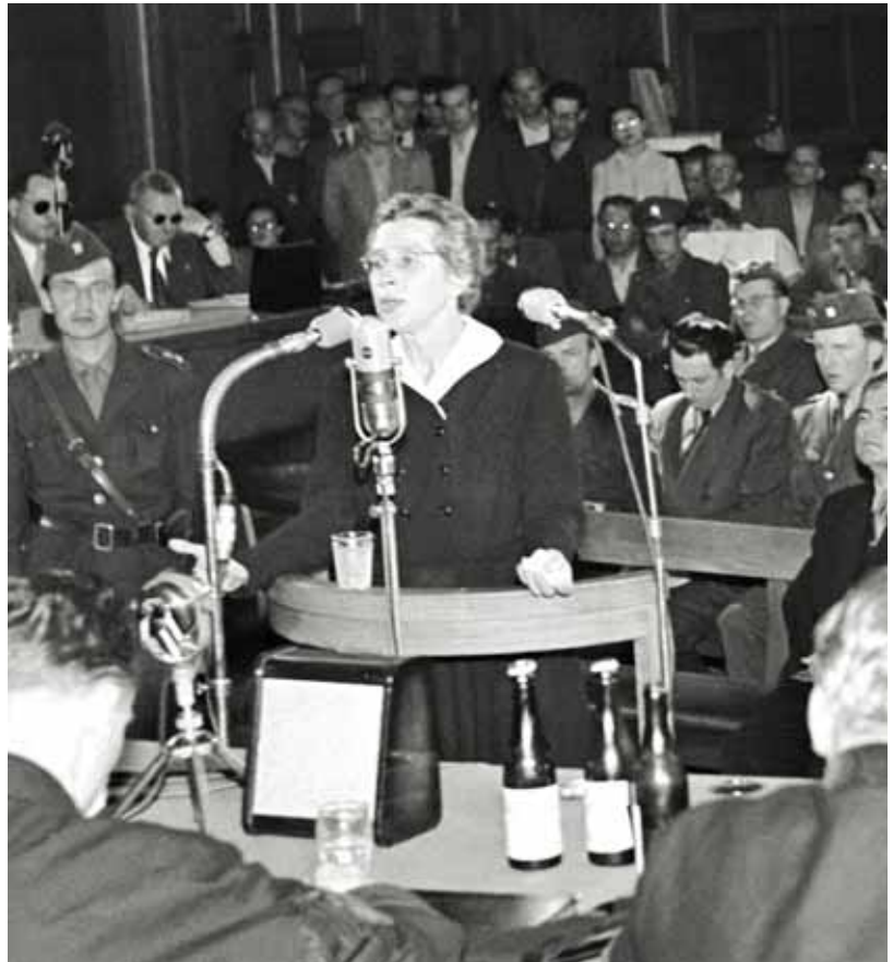
Proces s Miladou Horákovou a jejími druhy byl největším politickým procesem padesátých let. Odpovídala tomu i propagandistická kampaň, organizovaná komunistickým režimem.

Kraje měly podávat pražskému ústředí hlášení nejen o tom, jak pokyny z centra splnily, ale také o náladách, o ohlasu, o příp. incidentech a všech pozoruhodných zjevech v souvislosti s procesem. Závěr dálnopisu ÚV KSČ pak obsahoval výzvu ke zvýšení bdělos-