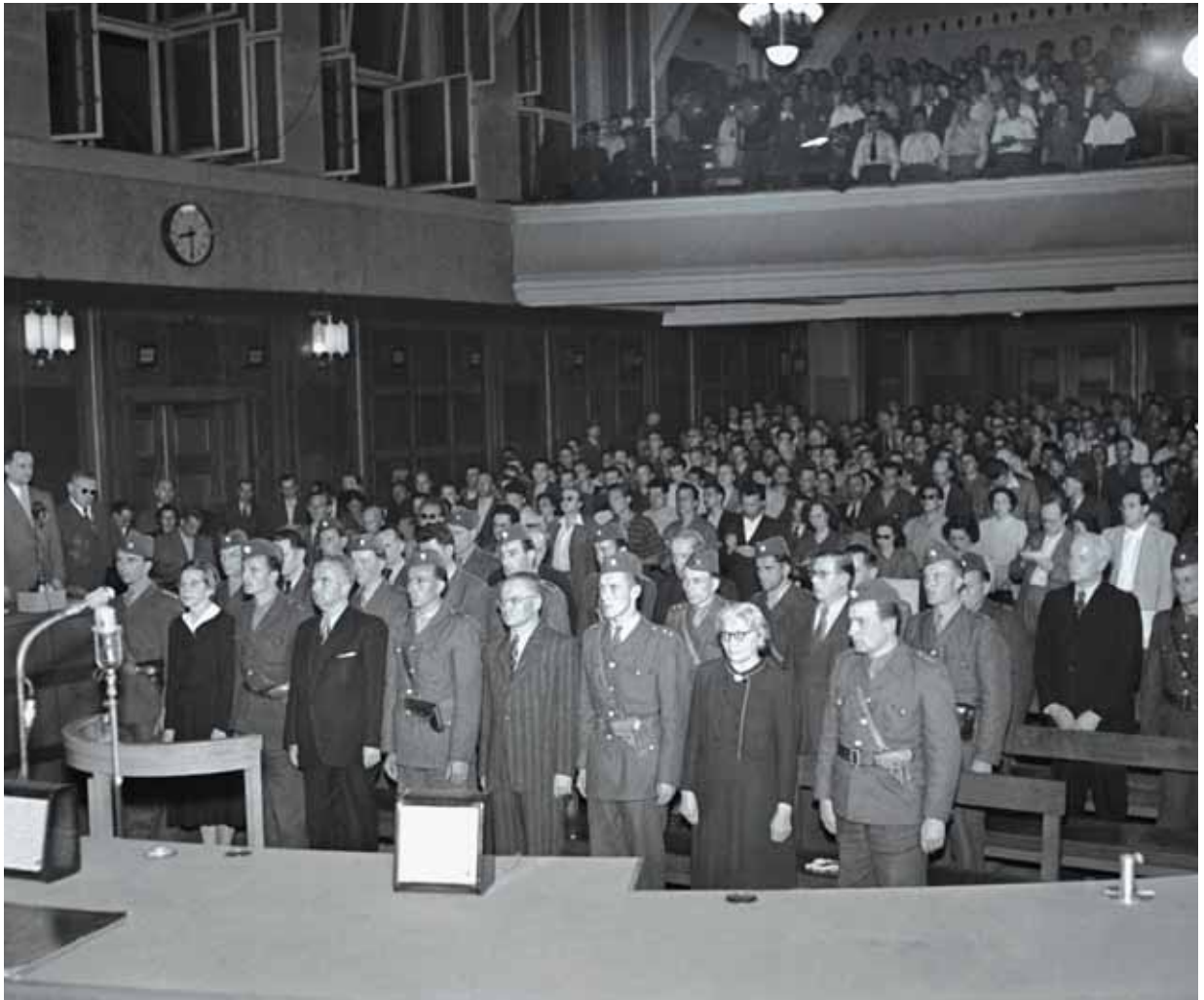
Státní soud na Pankráci, 8. června 1950 – vynesení rozsudku.

Větší ochrana žen . 97 Vedle něj se z fotografie „otcovsky“ usmívá J. V. Stalin.