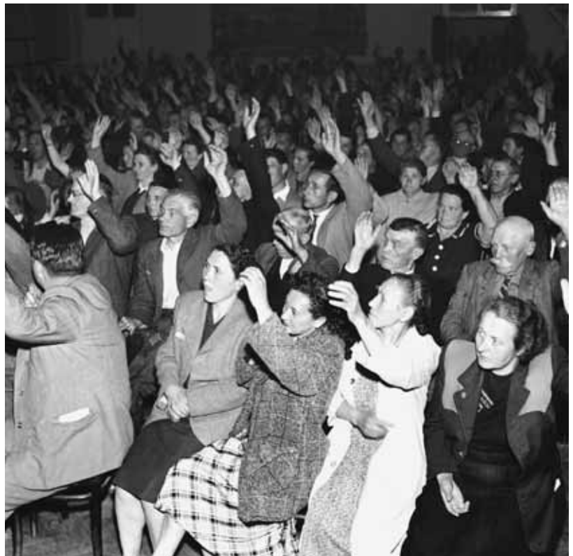
Jeden z tisíců projevů údajně „vůle lidu“ – občané Čakovic hlasují 2. června 1950 pro potrestání „vlastizrádců“ a „špiónů“.

Jak otevřeně přiznávají ve výše uvedeném hlášení ostravští komunisté, vládnoucí režim se sna-