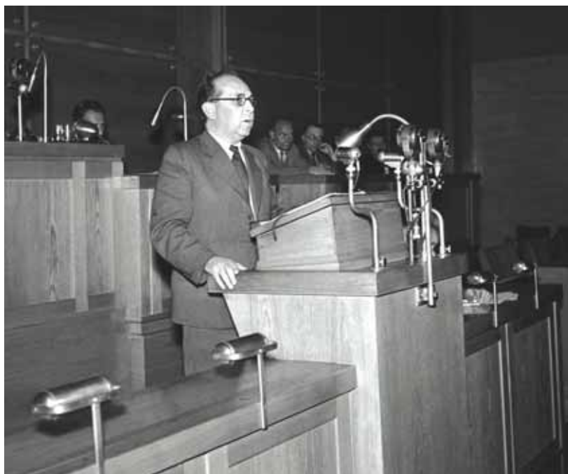
Ministr spravedlnosti Štefan Rais hovoří v Národním shromáždění 11. července 1950 o procesu s Miladou Horákovou. Jeho řeč byla později publikována knižně.

Na samý závěr této kapitoly nelze nezmínit hru Emila Františka Buriana Pařeniště . 80 Jak jsme uvedli výše, Alexej Čepička už v březnu 1950 prohlásil, že ministerstvo spravedlnosti vyzve umělce, aby se zapojili do propagačně výchovné práce a vytvořili díla,