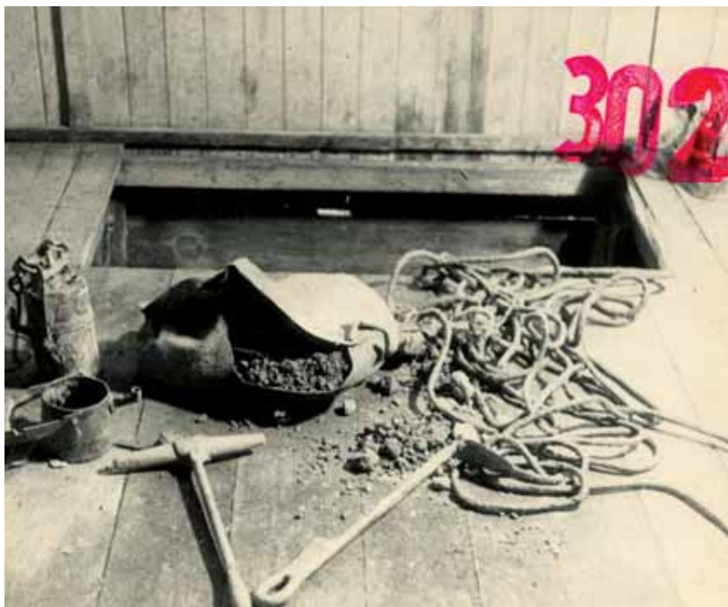
Náčiní, které vězni použili při práci na podkopu.