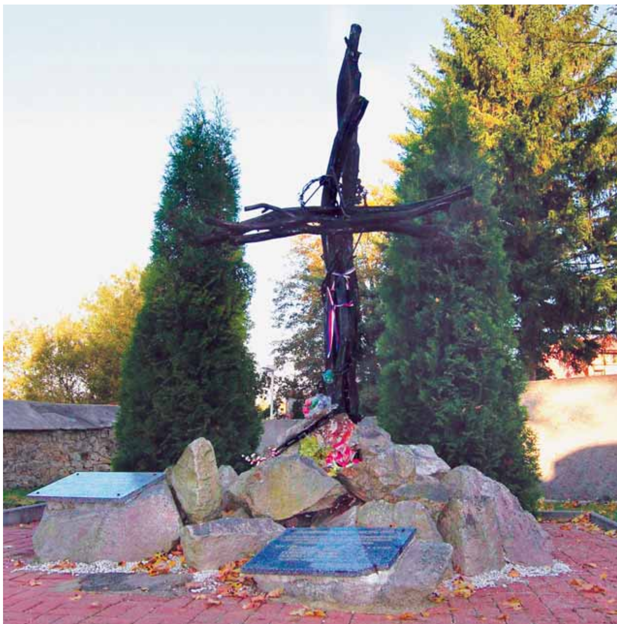
Tragické okolnosti útěku jedenácti vězňů z tábora XII připomíná dnes symbolický náhrobek na hřbitově v Horním Slavkově.