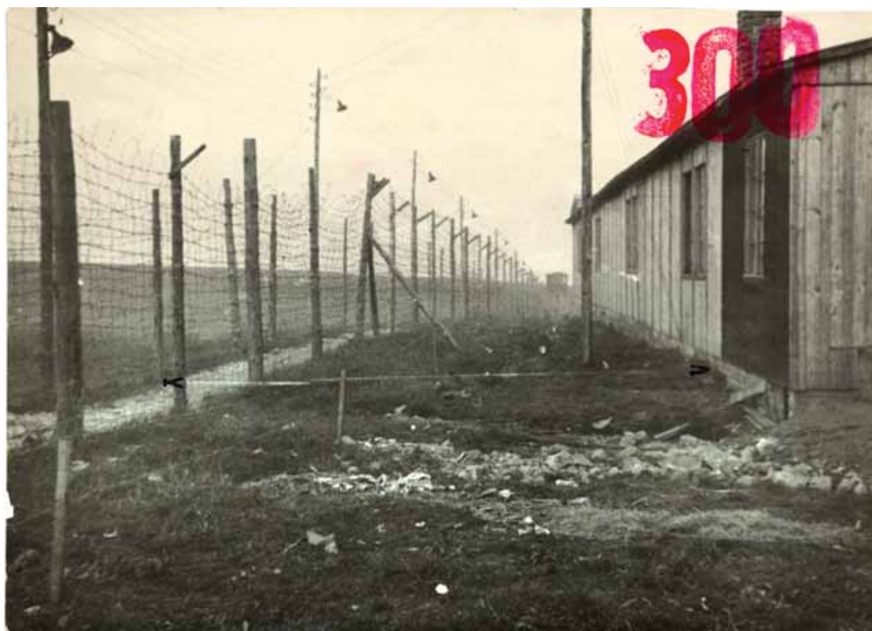
Pohled na barák číslo 2 v trestaneckém pracovním táboře Ležnice zachycující také část ostrahového pásma se „špačkárnou“. Šipky naznačují směr podkopu.

Tábory se od sebe lišily svou velikostí i podobou. Rovněž pod-