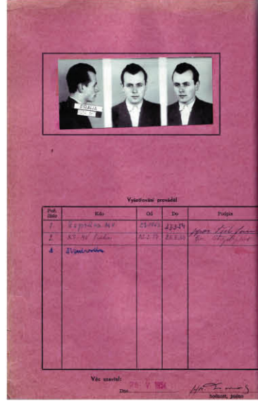
Obálka vyšetřovacího spisu Vladislava Křivohlavého.

Cover page of Vladislav Křivohlavý's case file.