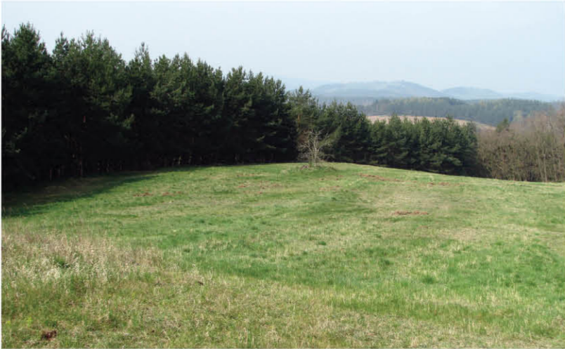
Uprostřed snímku je místo, kde byli nalezeni kurýři. Vrch Kočičák u Krásné Hory nad Vltavou.