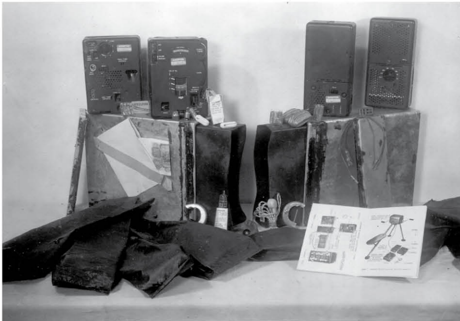
Radiostanice po vyjmutí z obalu