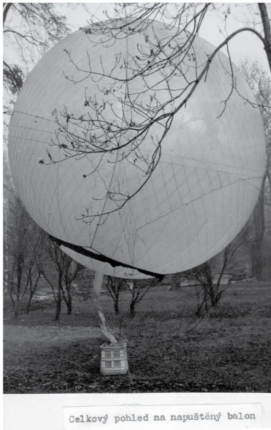
Celkový pohled na napuštěný balon