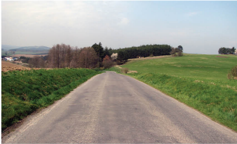
Pohled na místo tragické události u Krásné Hory nad Vltavou. Vlevo za terénní vlnou byla nalezena těla kurýrů. Pohled od Krásné Hory.

The scene of the tragic incident near Krásná Hora nad Vltavou. The couriers' bodies were found behind a ridge in the land on the left. Viewed from Krásná Hora.