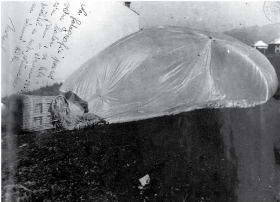
Fotografie Vajšova balonu, který neřízený přistál na Slovensku. A photograph of Vajša's balloon, which landed in Slovakia uncontrolled.