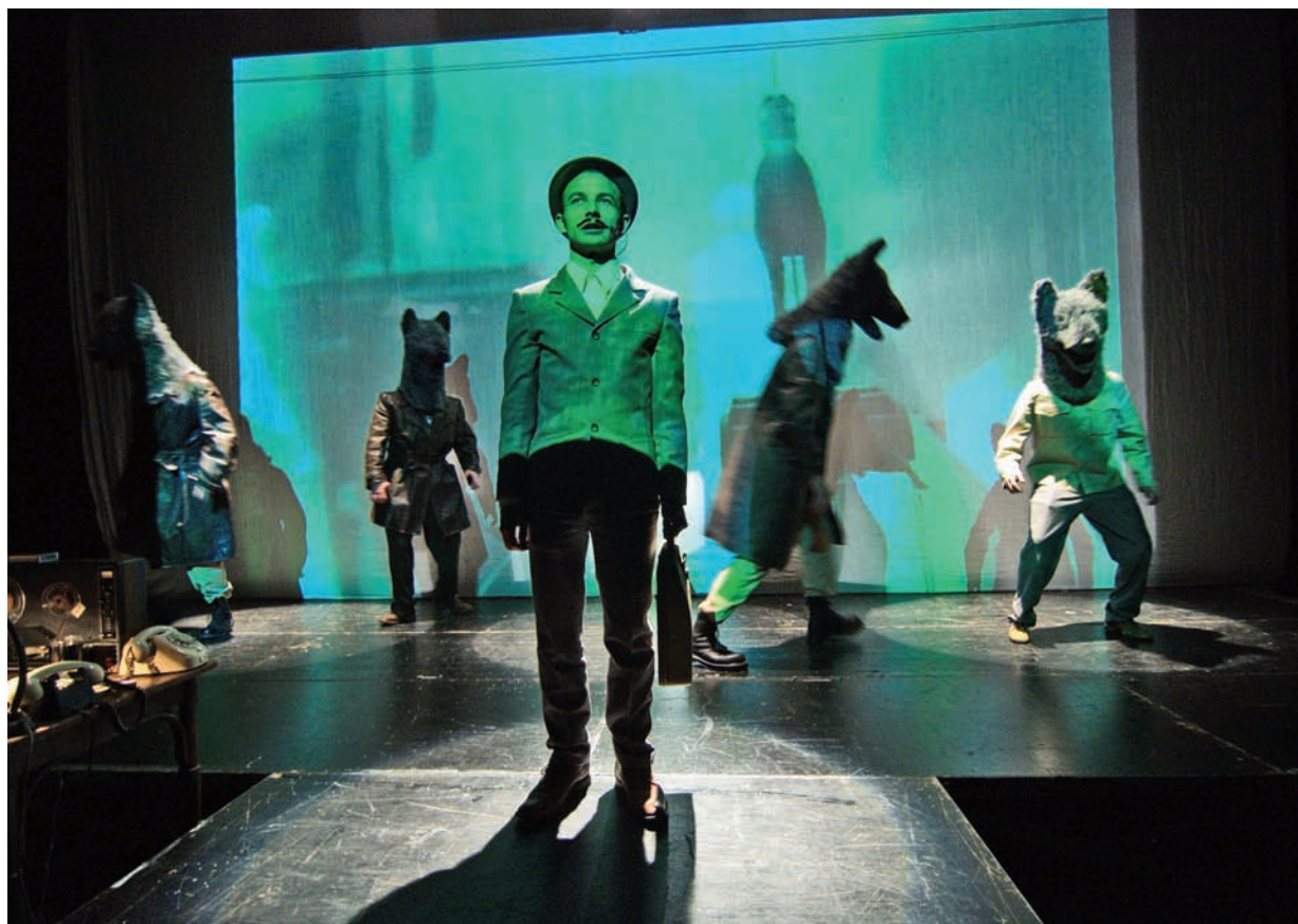
„Estébáci“ v akci