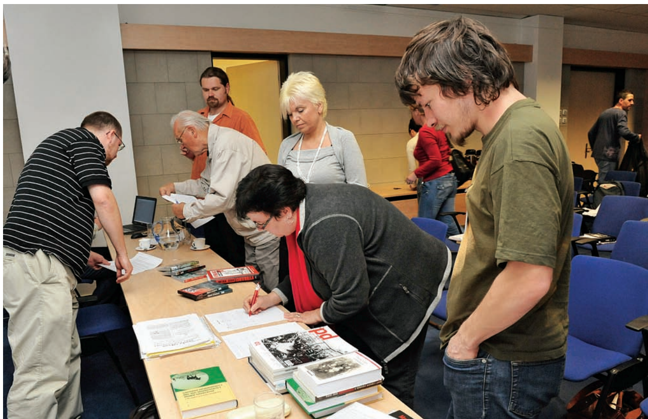
Účastníci semináře se podepisují do prezenční listiny a seznamují se s dostupnou literaturou k probíranému tématu

Spolupracujeme s celou řadou institucí. V první řadě s Ministerstvem školství, mládeže a tělovýchovy ČR, dále s Národním institutem pro další vzdělávání (NIDV), občanským sdružením PANT a mnoha dalšími. Členové naší skupiny jsou součástí ministeruského expertního týmu pro výuku dějepisu a v této pozici spolupracovali na formulaci doporučení MŠMT k výuce dějin 20. století. Ve spolupráci s MŠMT jsme se podíleli i na organiza-