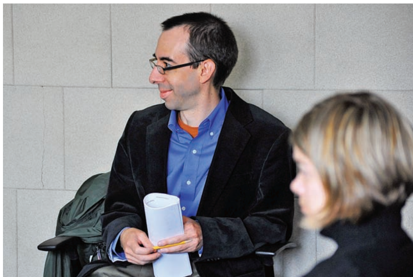
Americký historik Benjamin Frommer, jeden z přednášejících hostů metodického semináře

Na závěr jedna příhoda, která tyto problémy ilustruje. Při prezentaci své teze o účelovém vzpomínání a zapomínání na jednom ze svých metodických seminářů jsem se setkal s ostrou odmítavou reakcí kolegyně učitelky, která působila v jedné vzdělávací organizaci: Nezlobte se, pane Pinkasi, ale já s vámi absolutně nesouhlasím. Vy nás tady stavíte do role kolaborantů. Nás, kteří jsme na konci reálného socialismu žili své životy. My jsme nebyli pro režim. Na mou námitku, že fotografie z května 1989 zobrazující plné Václavské náměstí ukazuje na jiný vztah k režimu, odpověděla, že tam stejně byli všichni z donucení a že u nás se prostě nebojvalo. Odmítla připustit mou interpretaci účasti na prorežimní demonstraci jako aktu loajality vůči režimu. Tuto účast vůbec nevnímala v nějakém symbolickém významu, nedávala jí žádné (ani pozitivní, ani negativní) hodnotové významy. Prostě tak se tehdy žilo, nic jiného nešlo dělat. Bylo vidět, že ji má interpre-