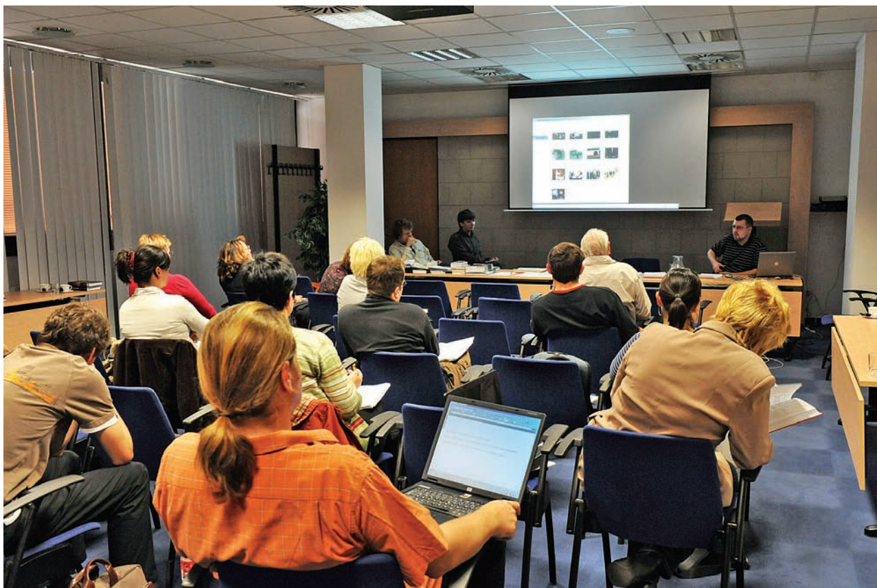
Metodické semináře poskytují učitelům dějepisu podněty pro výuku, například pro práci s audiovizuálním materiálem