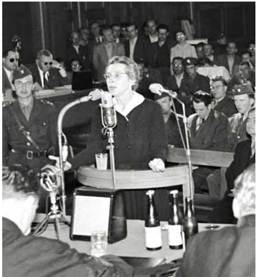
Proces s Miladou Horákovou a jejími druhy byl největším politickým procesem padesátých let. Odpovídala tomu i propagandistická kampaň, organizovaná komunistickým režimem.

Kraje měly podávat pražskému ústředí hlášení nejen o tom, jak pokyny z centra splnily, ale také o náladách, o ohlasu, o příp. incidentech a všech pozoruhodných zjevech v souvislosti s procesem . Závěr dálnopisu ÚV KSČ pak obsahoval výzvu ke zvýšení bdělos-