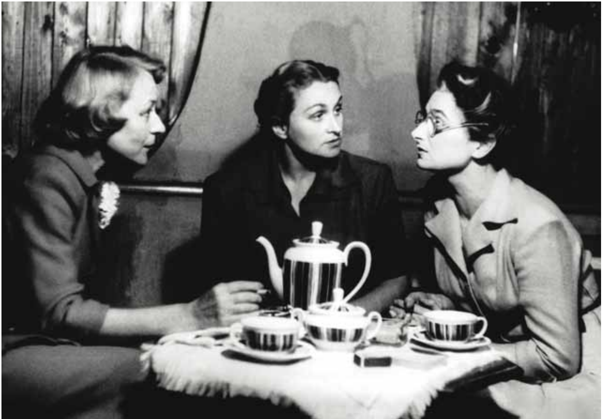
Některé postavy ze hry E. F. Buriana „Pařeniště“ nápadně připomínaly obžalované z procesu s Miladou Horákovou již svým zevnějškem.